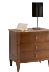
5874 M14 cm 65x45/65 in 25.6x17.7/25.6