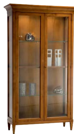
7877 M14 cm 120x45/215 in 47.2x17.7/84.6