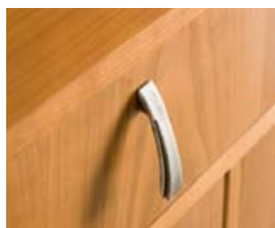
M15 Ferramenta contemporanea argento Modern fittings, antiqued silver Zierbeschläge modern, silber antik