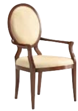
1339 cm 63x62/106/47 in 24.8x24.4/41.7/18.5