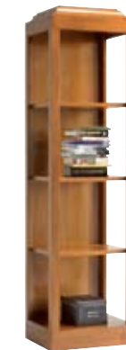
8874 cm 55x45/204 in 21.7x17.7/80.3