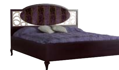
2874 cm 197x212/136/40 (180x200) in 77.6x83.5/53.5/15.7 (70.9x78.7)