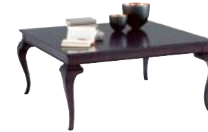
3874 cm 124x124/50 in 48.8x48.8/19.7