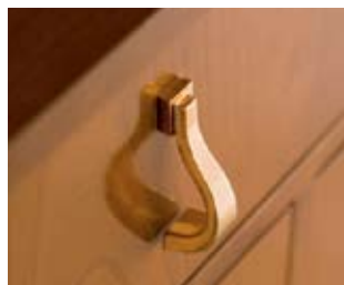
M16 Ferramenta classica dorata Classic fittings, gilded Zierbeschläge klassisch, vergoldet