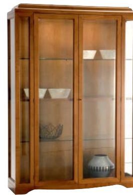
7879 M14 cm 140x45/204 in 55.1x17.7/80.3