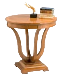
3877 cm Ø 70/70 in Ø 27.6/27.6