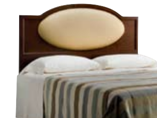
H2106 cm 206x6/136 in 81.1x2.4/53.5