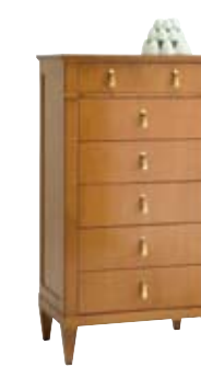
5876 M17 cm 65x44/120 in 25.6x17.3/47.2