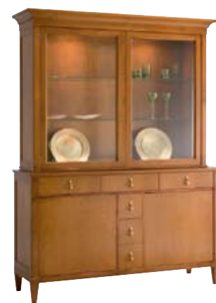
7876 M16 cm 162x50/217 in 63.8x19.7/85.4