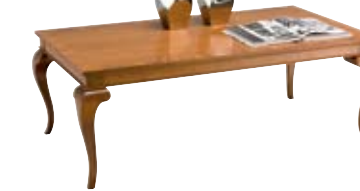
3875 cm 144x84/50 in 56.7x33.1/19.7