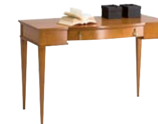
6875 M14 cm 120x60/78 in 47.2x23.6/30.7