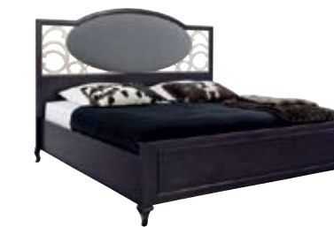
2875 cm 219x218/160/55 (201x206) in 86.2x85.8/63/21.7 (79.1x81.1)