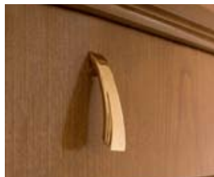
M17 Ferramenta contemporanea dorata Modern fittings, gilded Zierbeschläge modern, vergoldet