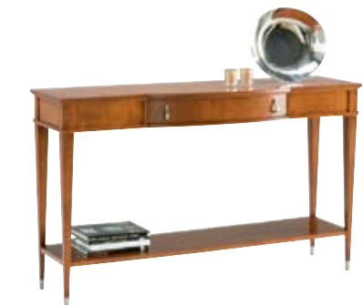
4874 M14 cm 150x45/90 in 59.1x17.7/35.4