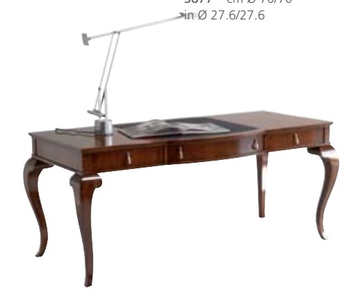
6874 M14 cm 187x83/77 in 73.6x32.7/30.3