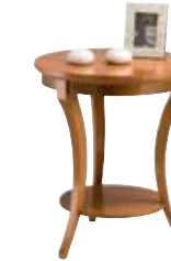
3876 cm Ø 55/64 in Ø 21.7/25.2