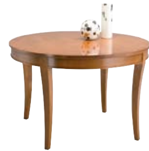
3878 cm Ø 120(160)/77 in Ø 47.2(63)/30.3