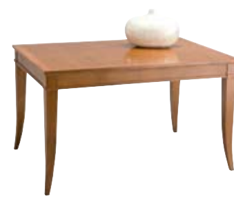
3880 cm 130(175)x90/77 in 51.2(68.9)x35.4/30.3