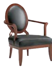
1341 cm 77x79/83/40 in 30.3x31.1/32.7/15.7