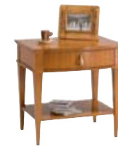
5877 M14 cm 60x45/60 in 23.6x17.7/23.6