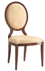
1338 cm 50x56/106/47 in 19.7x22/41.7/18.5