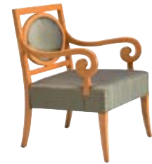
1874 cm 68x65/86/42 in 26.8x25.6/33.9/16.5