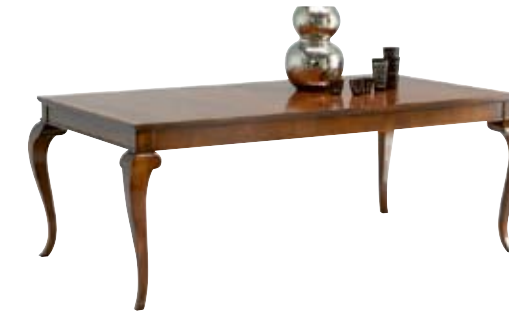
3882 cm 207(300)x117/77 in 81.5(118.1)x46.1/30.3