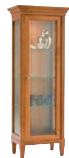
7878 M14 cm 63x40/165 in 24.8x15.7/65