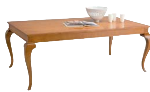
3879 cm 207x117/77 in 81.5x46.1/30.3