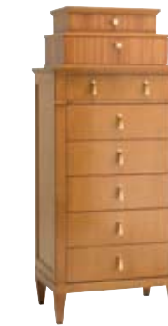
5820 M17 9874 M17