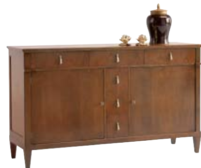
7874 M14 cm 162x50/96 in 63.8x19.7/37.8