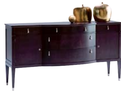
7875 M14 cm 196x57/102 in 77.2x22.4/40.2