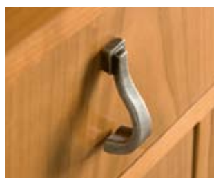
M14 Ferramenta classica argento Classic fittings, antiqued silver Zierbeschläge klassisch, silber antik