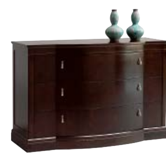
5875 M14 cm 145x57/96 in 57.1x22.4/37.8